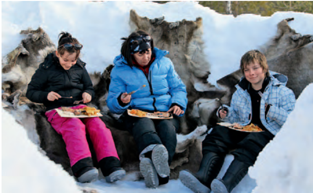
„Open Air-Restaurant“ mit Service am Wasser. Da schmeckt’s doppelt gut

So, die Unterwasserkamera ist wieder in Position – uund Aaaaaction! Sonny schickt seinen Saiblingslöffel auf die Reise Richtung Grund. Zuerst passiert gar nichts, die Bühne bleibt leer. „Da! Links, ein Schatten!“ Rund zwei Meter vom Köder entfernt kreisen die Saiblinge – und kommen Runde für Runde näher. „Hol’ ein Stück hoch! Bewege