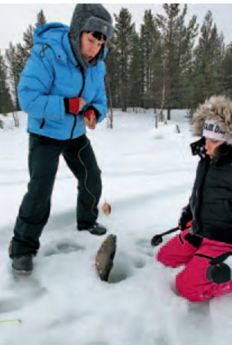
Bei der Pimpel wird nicht über die Rolle gedrillt - sondern per Hand