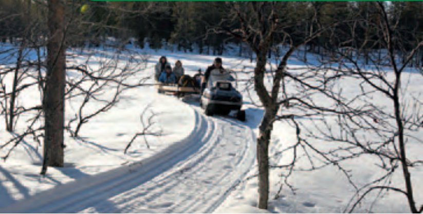
Nur per Schnee-Scooter und Schlitten kommt man an den See

Aus der Nummer komme ich nicht mehr heraus. Hocke hier im schwedischen Nirgendwo und werde von ein paar angelverrückten Schweden festgehalten. Meinen Vortrag morgen kann ich