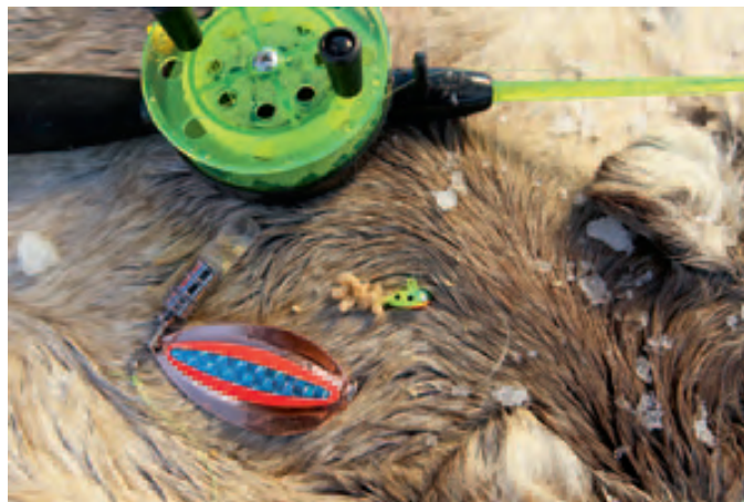
Flash Light, Saiblingslöffel und Mormyschka - die Erfolgsmontage

Kaum ist der Köder wieder am Grund, sind auch die Fisch zurück. Ah, die Saiblinge stehen auf Veränderungen. Allerdings merkt Martin schnell, dass sie das Interesse verlieren, sobald der Köder sich nicht mehr bewegt oder die Bewegung zumoton wird. Es muss doch mal einer beißen. So, nun reicht’s! Wie lange können die Saiblinge wohl den Köderreizen widerstehen. Martin greift tief in die Trickkiste und setzt auf ein Flash Light (zum Beispiel über WFT) am Saiblingslöffel. Dies-